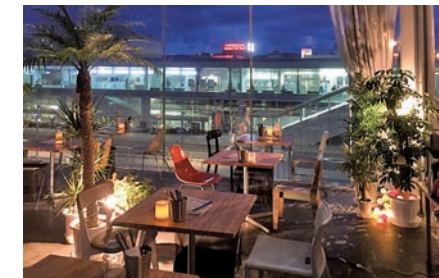
シーバースカフェ (車で 55 分*) *工場からの所要時間 (茨城東IC-ひたちなかIC間 高速利用)