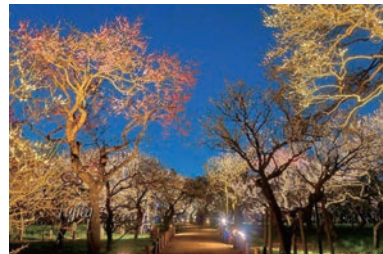
偕楽園 (車で 18 分*) *工場からの所要時間 (一般道利用)