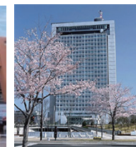
茨城県庁舎 (車で 10 分)