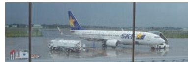
茨城空港・百里飛行場 滑走路2700m×2本