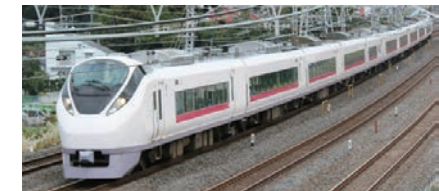
JR-EAST 特急ときわ (東京 - 水戸間 1 時間 15 分)