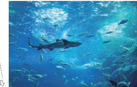
大洗水族館 (車で 27 分*) *工場からの所要時間 (一般道利用)