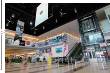
茨城空港ロビー (車で 31 分*) *工場からの所要時間 (一般道利用)