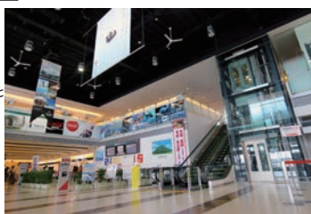
茨城空港ロビー (車で 31 分*)