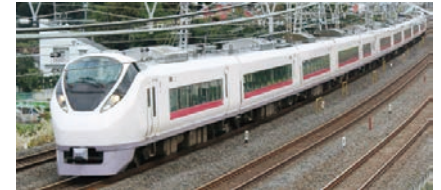
JR-EAST 特急ときわ (東京 - 水戸間 1 時間 15 分)