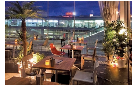
シーバースカフェ (車で 55 分*) *工場からの所要時間(茨城東IC-ひたちなかIC間 高速利用)