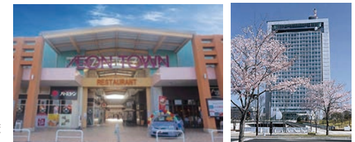
イオンタウン水戸南 (徒歩 7 分) 茨城県庁舎 (車で 10 分)