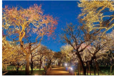
偕楽園 (車で 18 分*) *工場からの所要時間(一般道利用)