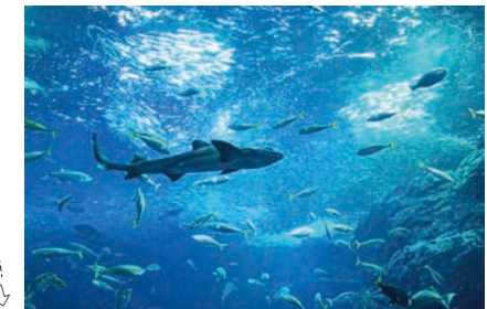
大洗水族館 (車で 27 分*) *工場からの所要時間(一般道利用)